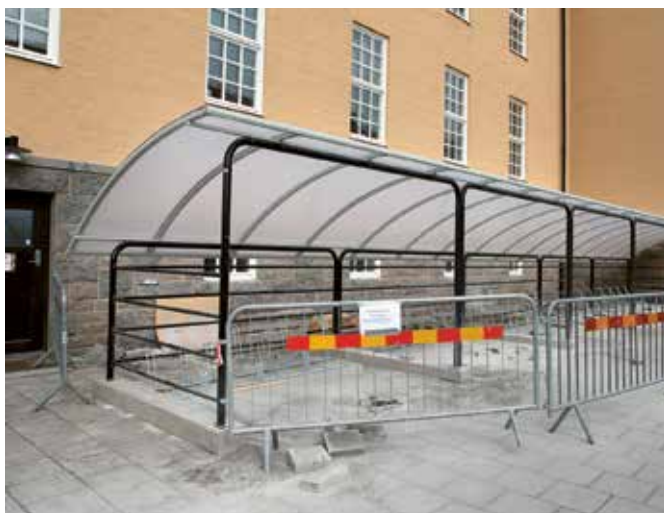
Många vill cykla till jobbet på Garnisonen och cykelställ under tak är uppskattade.

Garnisonsfastigheter förbättrar parkeringsmöjligheterna för cyklister. Två nya cykelställ med tak har installerats på Brigadgatan 10 och 14.