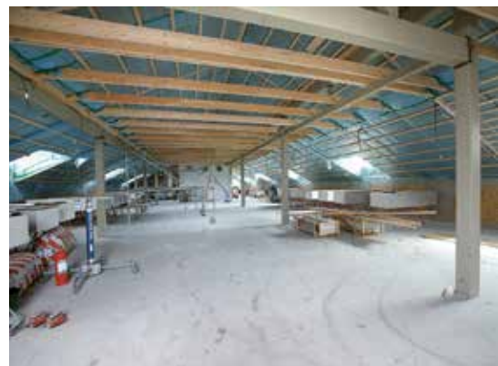
Tidsplanen för den nya byggnaden har hållits med god marginal. De här lokalerna är klara för inflyttning i februari 2016.

– Huset blir mycket modernt tekniskt sett, med energieffektiva lösningar och höga krav på säkerhet och skydd, tillgänglighet och miljö. Men gestaltningen anpassas till de äldre husen runtomkring, bland annat med tegel och putsad fasad. ■