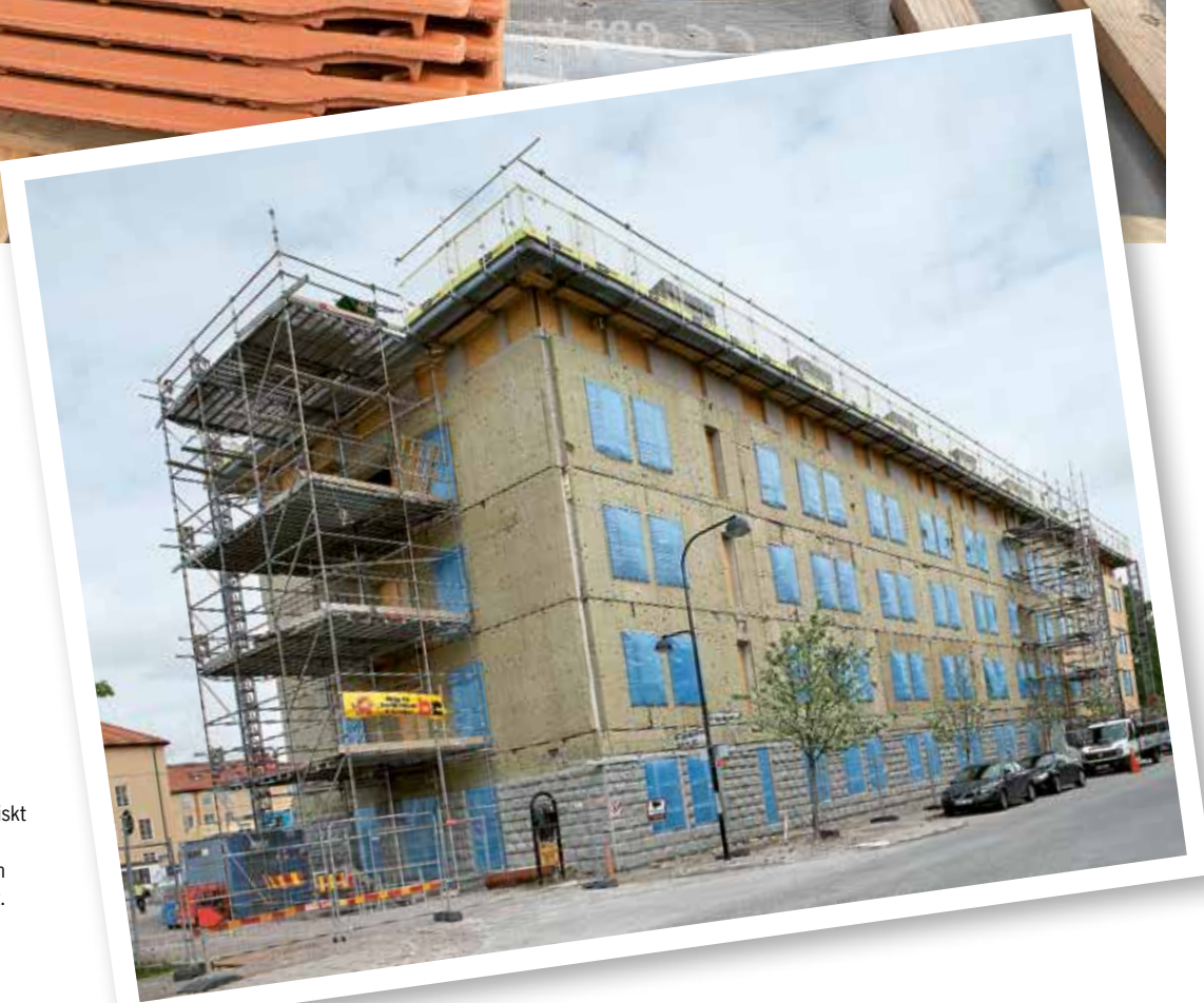
Huset på Brigadgatan 4 är tekniskt modernt samtidigt som det exteriört är helt anpassat till den befintliga arkitekturen i området.