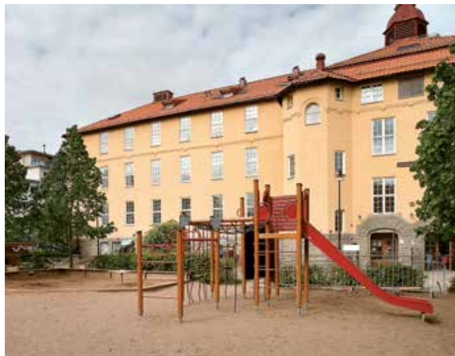
Det var i mars förra året som övre våningsplanet på Atlasskolan brann.

– Saneringsarbetet har ägt rum i tre steg. Först revs all skadad inredning ut, fukt och lukt sanerades. Lokalerna stod i princip stomrena. Vi rev även en del